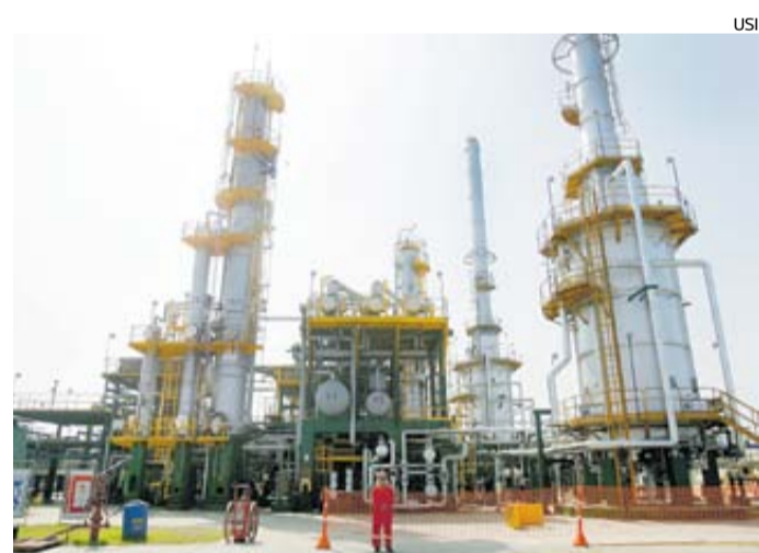
El año pasado la producción peruana de petróleo fue de 40 mil barriles diarios.

ratoria sobre derechos de importación, ya que se trata de una lista desactualizada, cuya modificación debe contar con la aprobación del Congreso de la República. “Una compañía en etapa de exploración quiso traer una perforadora de tecnología nueva, que no había venido antes del Perú, y no estaba en la lista, porque [la lista] era muy antigua”, ejemplificó y apuntó que el esquema data de 1994. “El problema es que los contratos, una vez que se suscriben, generan al inversio-