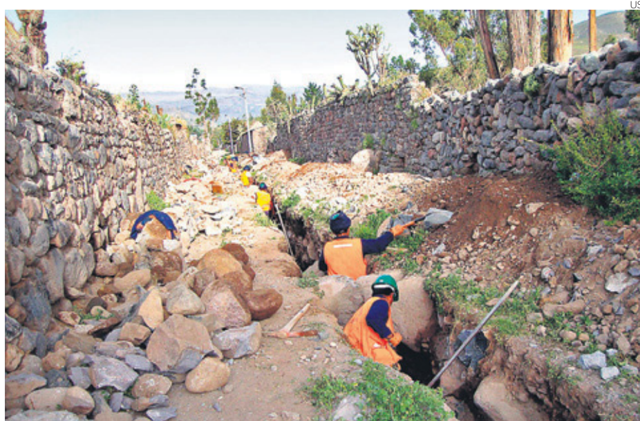
El Fonie busca financiar ‘combos’ de servicios, pero el 50% de distritos recibe dinero para un solo servicio.

“En el 2013 se aprobaron dos transferencias de recursos por S/.182 millones, pero con estos recursos no se financia algún combo completo (con los cuatro servicios)”.