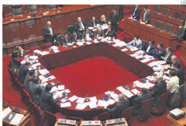
Comisión Permanente podría aprobar el proyecto en este mes.

“En la comisión también hay propuestas de mejorar la ley, las cuales se incorporarán en el proyecto del Ejecutivo, que confiamos en que será aprobada mañana